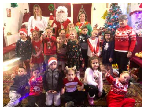
Nagycsoportosaink a pataki Mikulás Házban jártak