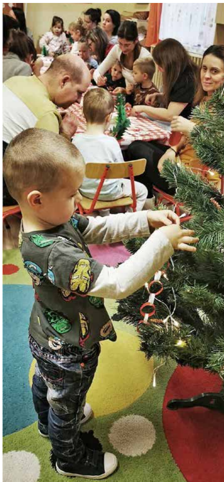
Adventi készülődés a kiscsoportban, szülőkkel közös munkadélután keretében