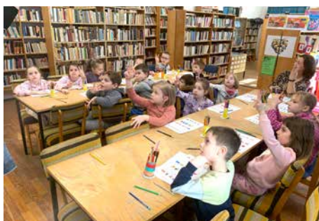
Könyvtárlátogatás a nagycsoportosokkal